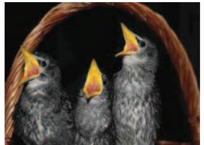
Warmia i Mazury to królestwo bociana, ale również idealne miejsce bytowania wielu rzadkich w skali globalnej gatunków ptaków

się doprowadzić do pełni sprawności. Fundacja Albatros przyjęła za jeden z celów projektu utworzenia sieci ośrodków, zapewnienie w każdym z nich odseparowanej części edukacyjnej, w której, za zgodą Ministra Środowiska będą mogły przebywać do końca życia kalekie zwierzęta potrzebujące azylu. Mamy nadzieję, że kontakt z nimi zwiększy wrażliwość i zainteresowanie problemami dzikiej przyrody. Na dopracowanie modelu funkcjonowania sieci we wszystkich jej aspektach zaplanowano najbliższe trzy lata. Warmia i Mazury staną się dzięki temu modelem, który w następnych latach można będzie wdrożyć stopniowo na terenie całego