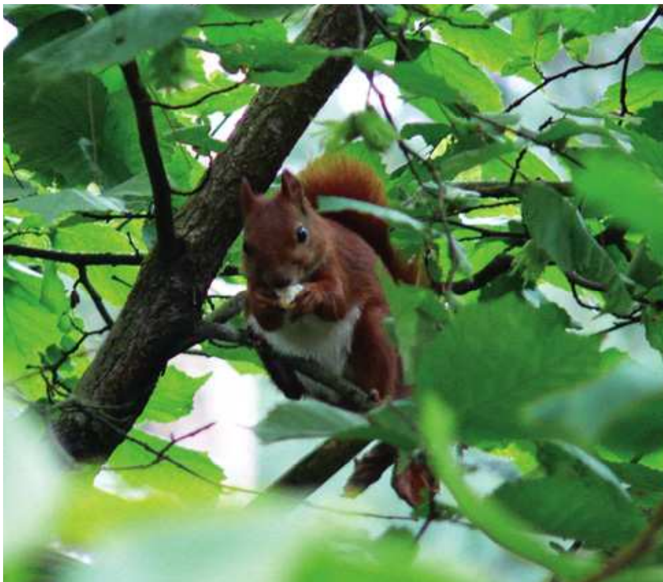
Zdjęcie miesiąca: Tomasz Pichola. Wiewiórka w lesie nad jez. Wulpińskim