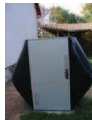
Pompa ciepła przy budynku Domu Wędkarza