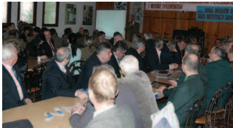
Seminarium Ogólnopolskie z okazji 15-lecia powstania Zespołu Parków Krajobrazowych Pojezierza Iławskiego i Wzgórz Dylewskich w Jerzwałdzie pt. „Rola parków krajobrazowych, jako instytucji samorządu województwa”