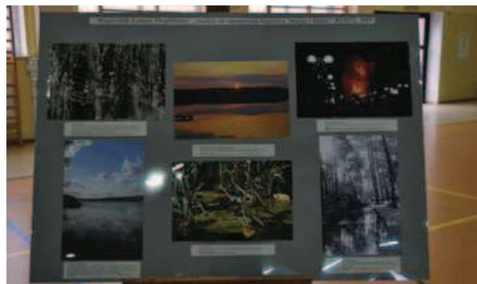
Celem konkursu było zachęcenie dzieci i młodzieży do poszukiwania pięknych obrazów przyrody i kultury naszego regionu oraz utrwalenie ich obiektywem aparatu fotograficznego.

Dzięki pozyskaniu funduszy z powyższych instytucji zwycięzcy mogli wyjechać z podsumowania naszego konkursu z aparatami fotograficznymi, plecakami i śpiworami firmy Campus oraz lornetkami. Wyróżnieni otrzymali pendrive.